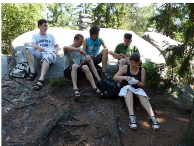
(s mládeží na prázdninovém pobytu)

Bývá zvykem, že součástí tohoto dopisu je složenka. Složenky chodí v mnoha dopisech a kde kdo si žádá nebo dokonce nárokuje, abyste jim přispěli, abyste je podpořili. Věc je jednoduchá: všechno stojí peníze. To se nevyhýbá ani našemu sboru. Jeho provoz stojí peníze a není to zrovna málo, jak jste se mohli dočíst v minulém dopise.